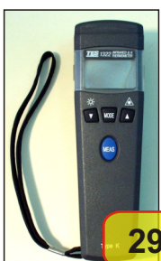
#02980 TES-1322 MIERNIK TEMPERATURY NA PODCZERWIEŃ

Wygodny, poręczny miernik do zdalnego pomiaru temperatury, do którego opcjonalnie można podłączyć zewnętrzną sondę pomiarową typu K dla wyższych zakresów temperatury. Wyposażony w laserowy wskaźnik.