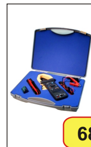
#03905 M-9911 WATOMIERZ CĘGOWY

Wyspecjalizowany multimetr cyfrowy służący do pomiaru następujących parametrów: W, VA, VAR, kWh, współczynnik mocy. Posiada duży wyświetlacz pełne 4 cyfry z bargrafem. Wyposażony jest w cyfrowy timer (zakres 50 h) do pomiaru mocy czynnej.