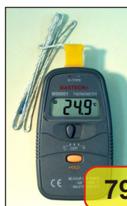
#03915 MS6501 TERMOMETR CYFROWY

Pomiar temperatury w °C lub °F. Standardowo wyposażony jest w sondę temperaturową typu "K01". Wyświetlacz LCD 3 i 1/2 cyfry, posiada funkcję "HOLD" (pamięć odczytu).