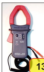
#03920 MS3300 CĘGOWY PRZETWORNIK

Cęgowy przetwornik prądu zmiennego i stałego, stosowany jako przystawka rozszerzająca możliwości pomiarowe woltomierzy. Zgodny z normą IEC1010-2-032. Maksymalna średnica przewodów wynosi 50mm.