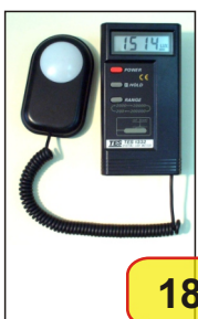
#02964 TES-1332 CYFROWY LUKSOMIERZ

Cyfrowy lukso mierz do pomiaru poziomu oświetlenia z przetwornikiem w osobnej obudowie z przewodem o dł. 1,5m. Czulość spektralna zawarta w krzywej optycznej CIE z korekcją kąta widzenia. Wyświetlacz LCD 3 i 1/2 cyfry. W komplecie futerał.